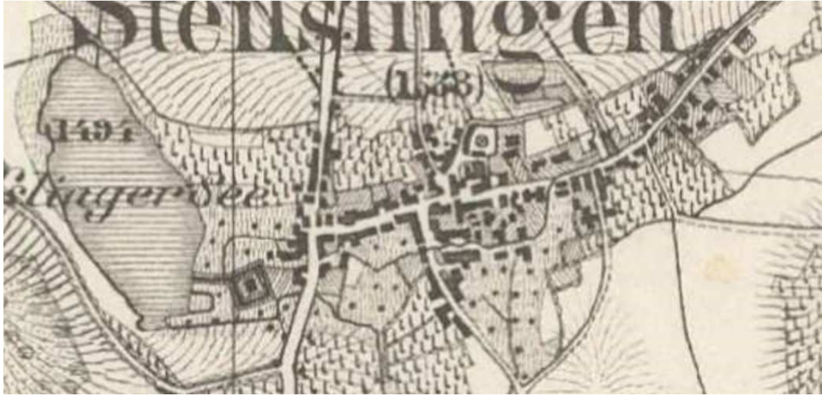
Abb.: Karte des Grossherzogthums Baden (1838-1849)

Bei einem Blick auf die historische Karte lässt sich ablesen, wie sich auch heute noch die drei Teile des Sanierungsgebiets unterscheiden: